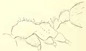
Fig. 3. — Le même, thorax et pédicelle vus de côté.

angle subdenté. La distance qui sépare ces angles est un peu plus grande que celle qui les sépare des yeux. Ceux-ci sont placés en arrière du milieu des côtés de la tête. Les lobes frontaux sont assez fortement rabattus latéralement comme chez pilosum , mais bien plus larges et plus anguleux. L'épistome est relativement très court avec un bord antérieur régulièrement arqué. Mandibules finement striées avec une bande lisse le long du bord denté qui compte 9-10 dents.